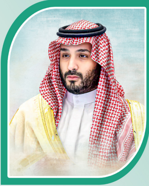
صاحب السمو الملكي الأمير