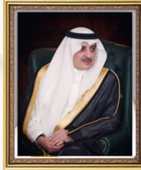
صاحب السمو الملكي الأمير فهد بن سلطان بن عبدالعزيز آل سعود أمير منطقة تبوك رئيس مجلس الإدارة